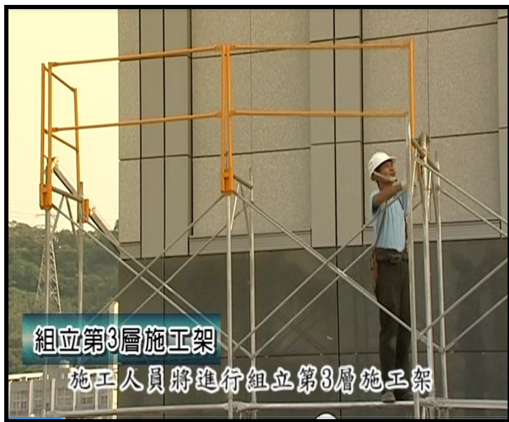
扶手先行工法示意圖